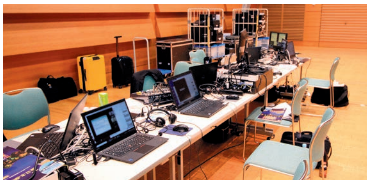
岡山コンベンションセンターの配信基地の様子です。