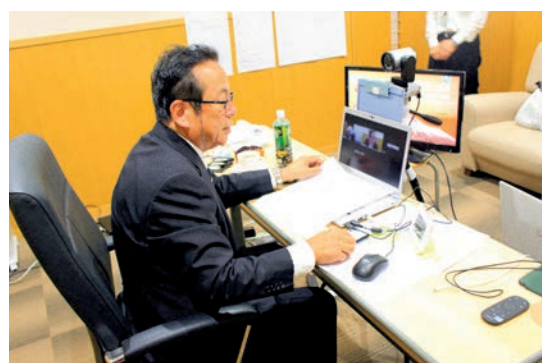
WEB 配信中の様子です。