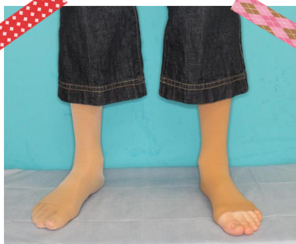
右足: 普通ストッキング重ね履き 左足: 弾性ストッキングのみ